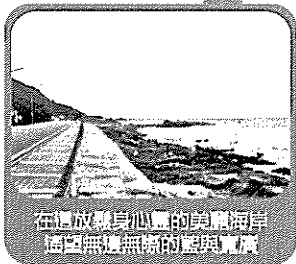
在這放慢身心靈的美麗海岸， 遙望無邊無際的藍與黃。