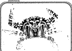
石蟬、花蟹、三點蟹 三大名蟹！老饕的最愛~