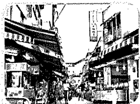
金山市區內，古香古色的街道，還有許多美食和商店。