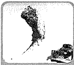
世界級海岸風化地質景觀，探討大自然造物的奧妙。