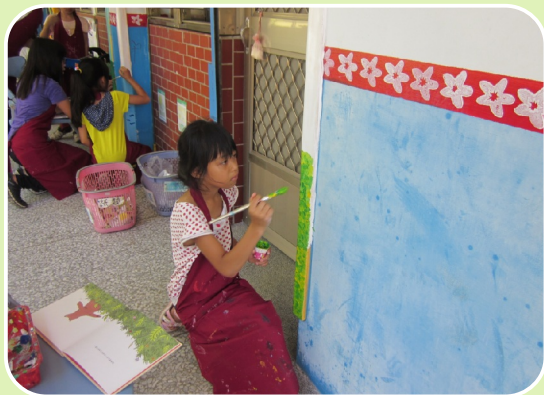
防撞條彩繪活動-我最喜歡的書本插圖