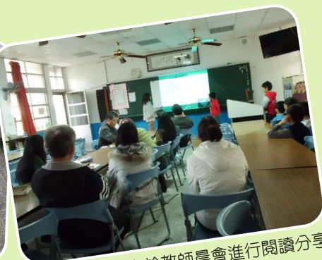
本校四年級學生於教師晨會進行閱讀分享