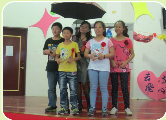
畢業典禮師生創作表演