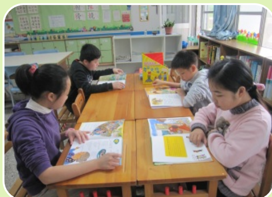
六年級學生運用圖書角進行晨讀