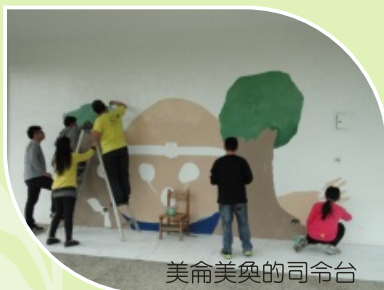
美侖美奐的司令台

各種多元的課程，在經歷一年多的統整、融合中，讓孩子能遵守團隊紀律，懂得小組合作與善用創意與技能，將閱讀過的文本藉由「色彩」、「圖像」與「創造力」，在防撞條、穿堂、牆面上留下共同創作的作品，讓校園更加多采多姿，也更有歸屬感。