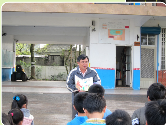
親子共讀繪本創作介紹