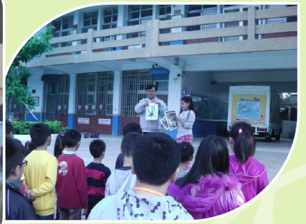
四年級學生於學生晨會進行發表