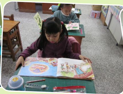
本校二年級學生進行晨間共讀