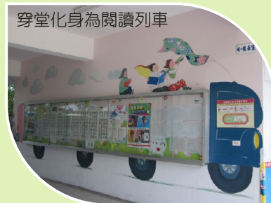
穿堂化身為閱讀列車