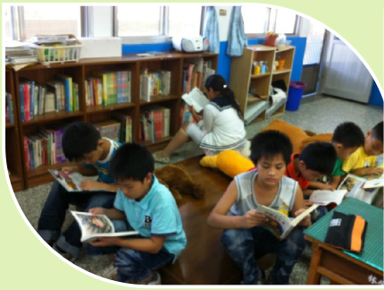
四年級學生運用圖書角進行晨讀