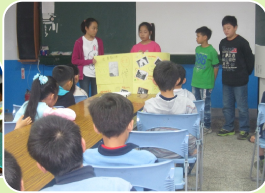
六年級學生於學生晨會進行發表