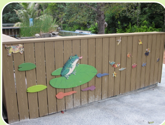
水生植物園裝飾藝術