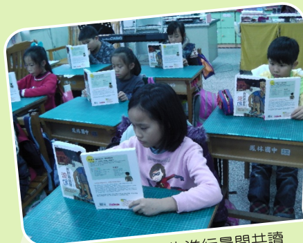
本校三年級學生進行晨間共讀