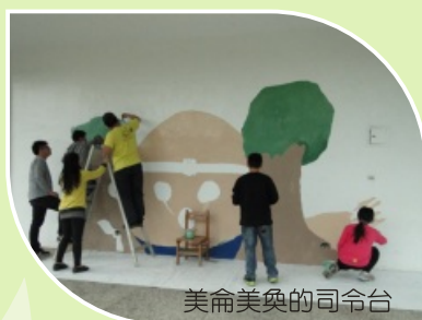
美侖美奐的司令台

各種多元的課程，在經歷一年多的統整、融合中，讓孩子能遵守團隊紀律，懂得小組合作與善用創意與技能，將閱讀過的文本藉由「色彩」、「圖像」與「創造力」，在防撞條、穿堂、牆面上留下共同創作的作品，讓校園更加多采多姿，也更有歸屬感。