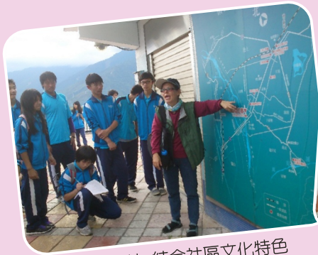
閱讀大地_結合社區文化特色