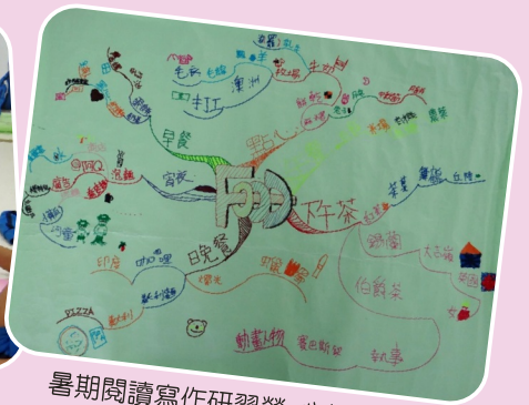
暑期閱讀寫作研習營_心智圖成果