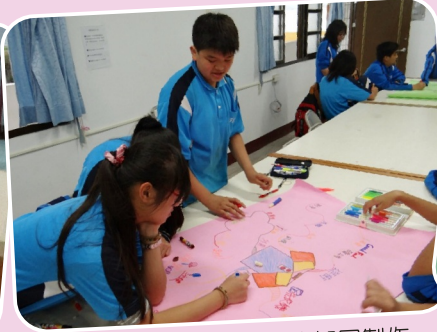
暑期閱讀寫作研習營_心智圖製作