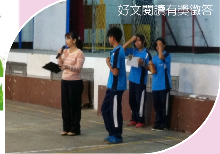
好文閱讀有獎徵答