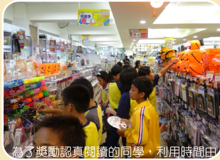
為了獎勵認真閱讀的同學，利用時間中學校老師帶領小朋友到書局，讓小朋友購買自己喜歡的文具用品和書籍。