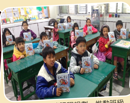
透過各項閱讀課程規劃，推動班級讀書會。