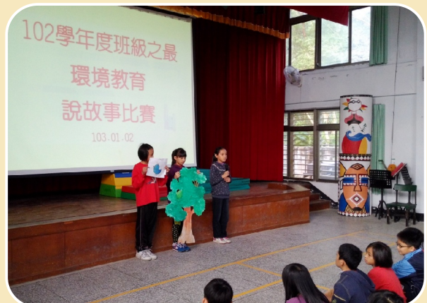
每學期進行班級之最一說故事比賽，透過閱讀→理解→摘要→發表的學習歷程，擴大學生的閱讀層面。

校長能以身作則，領導教學團隊投入各項閱讀教學活動，計畫周詳，具體可行。能檢核閱讀能力，建立閱讀學習護照，辦理主題書展，值得肯定。