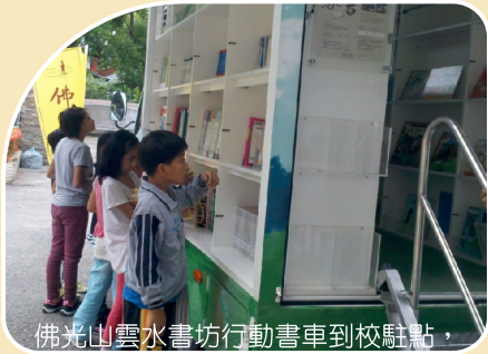
佛光山雲水書坊行動書車到校駐點，帶來許多不同的書籍，擴大學生閱讀的視野。