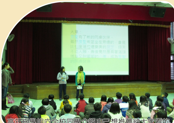
高年級學姐向全校同學介紹自己想推薦給大家看的書，透過學生的觀點來分享書本的內容，比老師介紹的更具吸引力。

十二、暑假快樂閱讀營活動：本校為讓學生能有一個充實的暑假，積極與秀林鄉圖書館合作，辦理暑假快樂閱讀營活動，聘請講師指導小朋友製作繪本、手工書，讓小朋友能發揮創