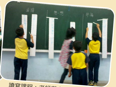
讀寫課程：老師與大家一起討論並引導寫作。

力，因此規劃讀寫課程，期望做到「讀寫結合」，以提升學生語文能力。為延續長期建立的討論氛圍，以「深耕閱讀」為主題，針對閱讀教學相關策略提出經驗分享及討論，透過教師間的相互激盪和共識凝聚，共同為校園閱讀推廣活動而努力。