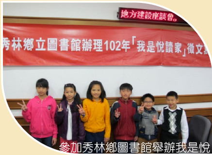
參加秀林鄉圖書館舉辦我是悅讀家徵文比賽成績優良同學至秀林鄉公所接受鄉長表揚