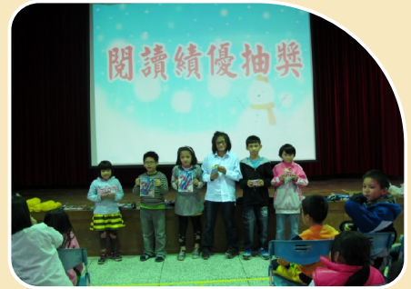
每年舉辦閱讀績優抽獎活動，希望能激勵所有同學都樂於閱讀。