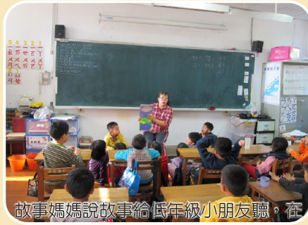
故事媽媽說故事給低年級小朋友聽，在還不識字的階段，先經由「聽故事」來培養未來閱讀書本的興趣。