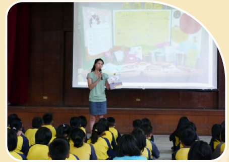
辦理主題書展活動，並由閱讀推動老師介紹相關書籍。

題進行『主題書展』，展示館內與主題相關的書籍進行延伸閱讀活動，藉由這樣的活動讓圖書室與讀者有更多的互動與交流，豐富學生的閱讀領域。