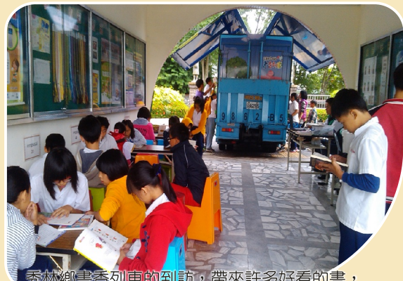
秀林鄉書香列車的到訪，帶來許多好看的書，小朋友們已經懂得把握機會辦理借閱，慢慢享受自己喜歡看的書！