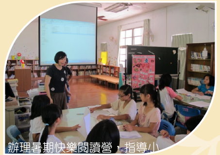
辦理暑期快樂閱讀營，指導小朋友發展自己的故事，製作屬於自己的繪本。