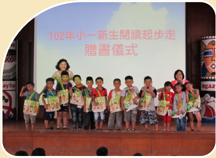
贈書儀式：送給佳民小一生最好的禮物。