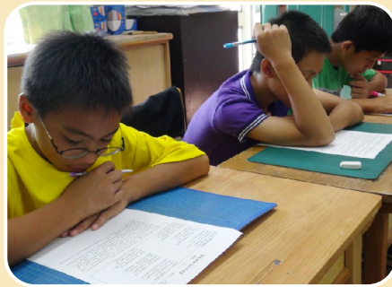
定期辦理閱讀能力檢核，作為老師補救教學依據。