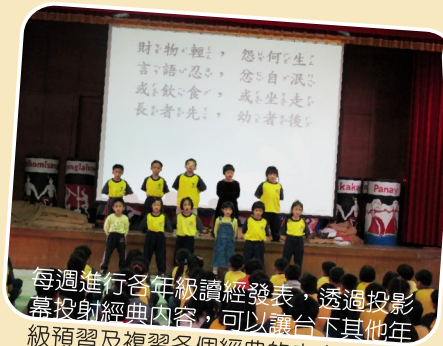
每週進行各年級讀經發表，透過投影幕投射經典內容，可以讓台下其他年級預習及複習各個經典的內容，提升學習成效。