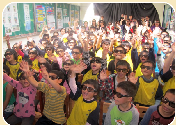
美力台灣3D電影欣賞