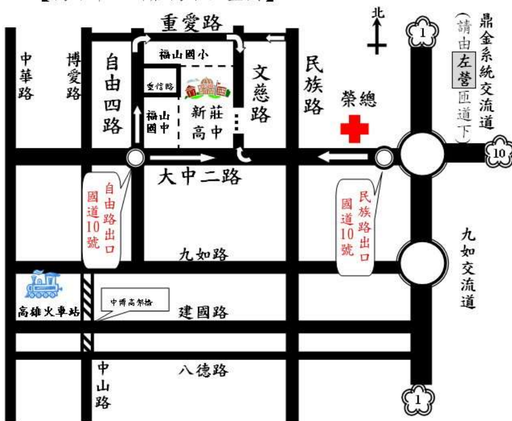
【高雄市立新莊高中位置圖】