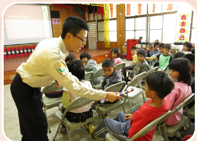
替代役哥哥說故事02