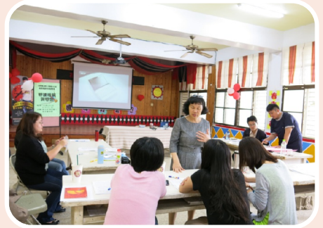
教師研習~閱讀理解與問思(教師實作)