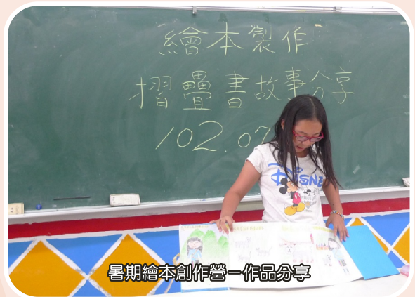
暑期繪本創作營-作品分享