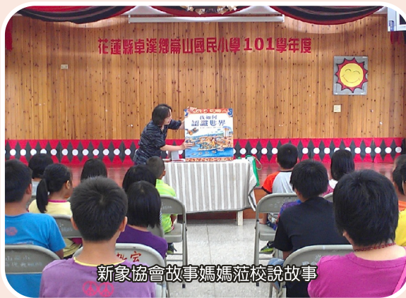
新象協會故事媽媽蒞校說故事