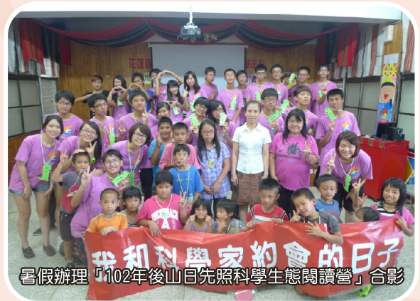
暑假辦理「102年後山日先照科學生態閱讀營」合影