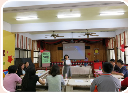
教師研習~閱讀理解與問思