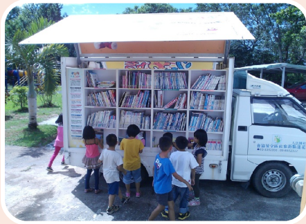
新象協會行動書車