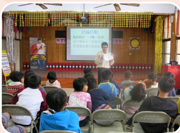
替代役哥哥說故事01