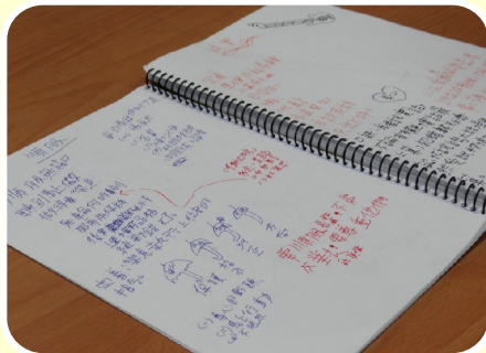
三年級孩子的閱讀課筆記