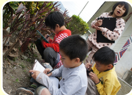
觀察土鵝生蛋的樣子 並畫下來