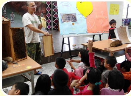
阿坤叔叔談養蜂甘苦