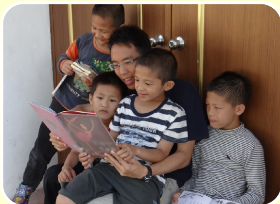
替代役哥哥的故事總是特別親切沒有距離