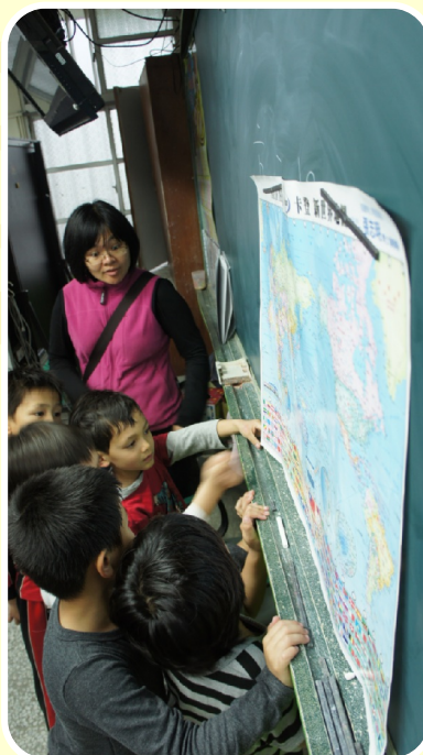
法國小朋友來訪～ 找找地圖 法國在哪裡