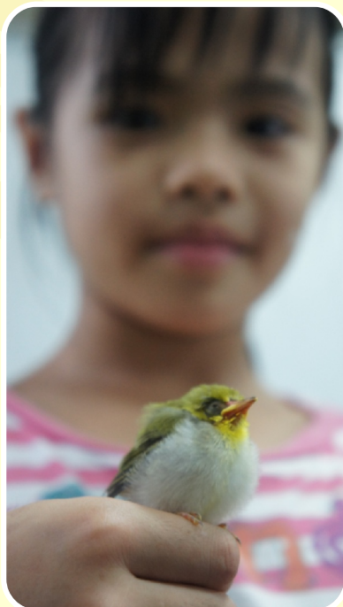
打掃時在樹下撿到的綠繡眼寶寶

以密笈為主軸建構閱讀教學頗具特色，結合社區資源，擴展學生閱讀視野，需更聚焦於呈現結果，更有層次的呈現歷程。