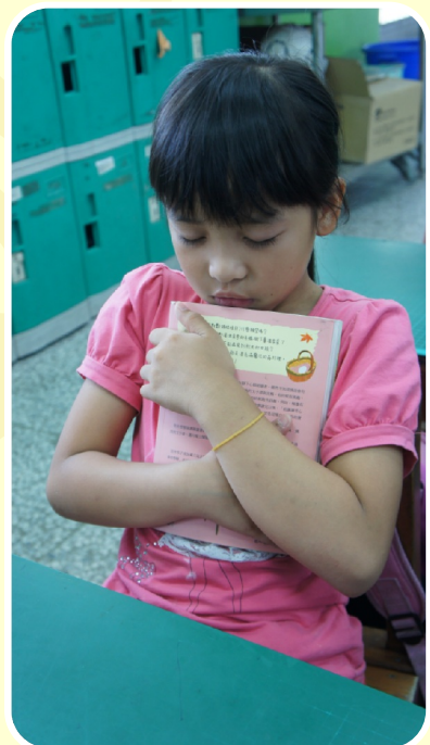
孩子共讀完書籍 對書裡的主角說悄悄話