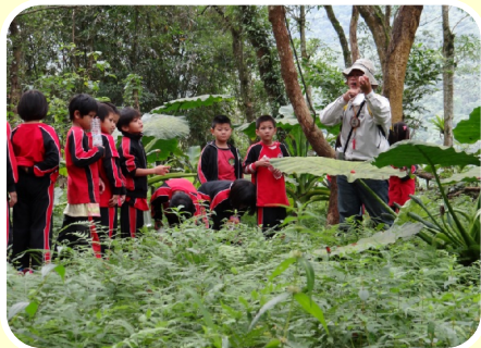
到池南閱讀黑熊的生活環境