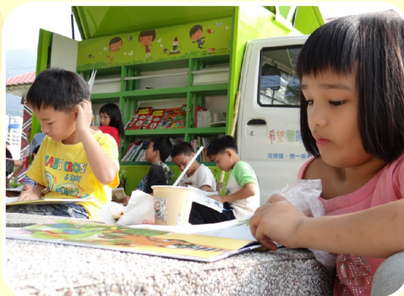
天下閱讀行動車到訪