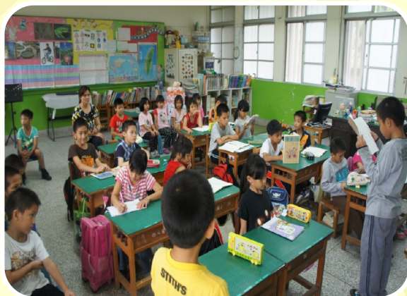
孩子和同學分享生活札記