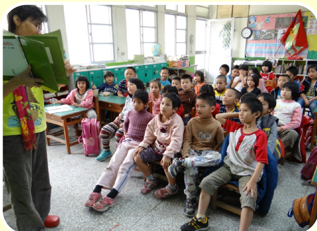
早療協會乃馨老師故事時間