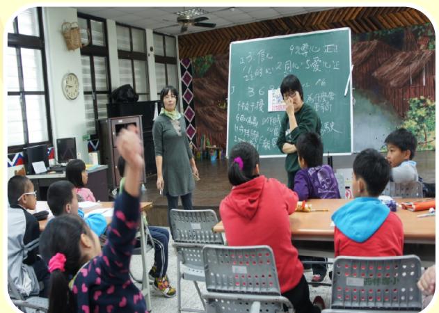
啄木鳥協會每週三的品格故事