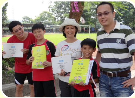
參加天下希望閱讀的圖文創作比賽