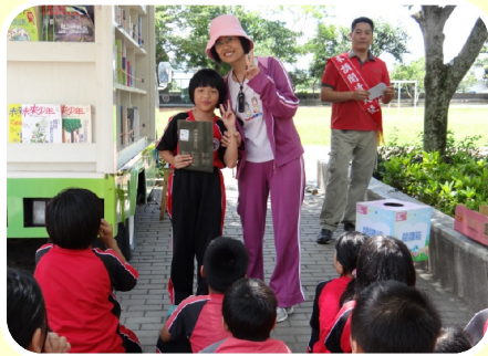
誠品閱讀行動車還有閱讀大使喔