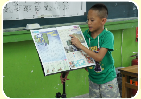
孩子讀報 摘錄重點 並分享