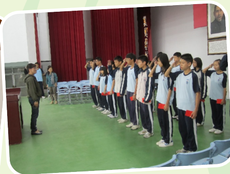
頒發投稿學生獎勵金