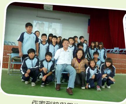
作家到校與學生交流