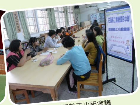
家長閱讀義工小組會議

教學，發展學校特色，學校規劃「壽豐藝文獎」。徵稿類別分為散文類、新詩類及漫畫類，創作主題不拘，凡是描述本校校園景觀、師生生活點滴、社區文化、風土人情等有關內容皆可，書寫題目可自由發揮。各類取前三名，發給獎狀、獎金及獎座，另取佳作數名發給獎狀及獎品。得獎作品經過美編裱褙，長期展示於本校走廊、穿堂，供師生欣賞。這項比賽可說是獎金豐厚，獎品多樣，歷年來已有效提升學生的寫作意願與創作素質，可說是本校重要特色之一。