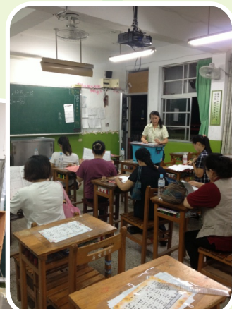
導師與家長溝通閱讀習慣