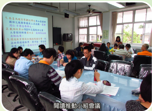
閱讀推動小組會議

本校是屬於偏鄉的小型學校，學生普遍缺乏閱讀習慣，因此，營造良好的閱讀環境一直是本校重要的教育目標之一，希望藉由閱讀來激發學生的學習動機及擴大生活視野，近幾年配合教育部「偏遠地區國民中學學生閱讀推動計畫」，在持續的推動之下，閱讀已然成為全校運動，圖書室的書籍增加了，學生借書的頻率也大幅提升，這真是令人振奮的進步。本校推動閱讀分為兩大方向，橫向是大量閱讀、廣泛閱讀、多元閱讀及快樂閱讀，目的在於鼓勵學生由不同的閱讀管道、閱讀方式、閱讀材料多方閱讀，從閱讀中開展學生的心胸及視野，啟發學生的閱讀興趣；縱向則是要培養學生深度閱讀的能力，從課程中發展出學生的想像力、激發學生的思考力、進而培養學生的分析力及創造力，對於學生的閱讀能力可說是全面性的發展與提升。