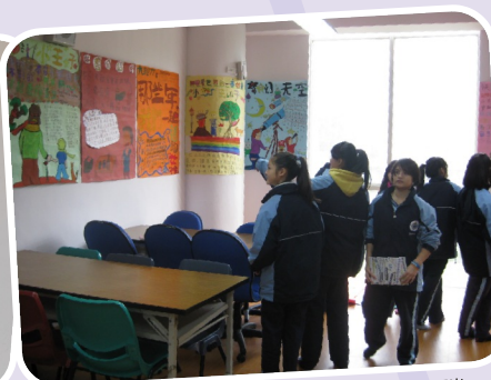
好書介紹壁報比賽－藉以引人入勝