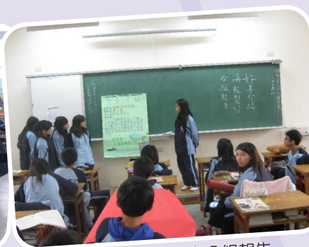
好書介紹海報製作分組報告