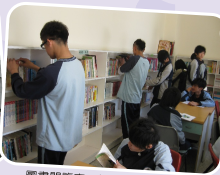
圖書閱覽室－提供便利借閱空間