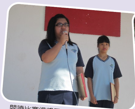
閱讀比賽得獎同學於晨間心得分享－ 分享閱讀喜悅及成果