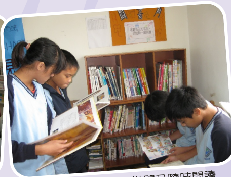
班級圖書角－方便借閱及隨時閱讀

不給學生這個機會，學生們可能就喪失了最好的改變學習的契機。在秀林國中如此文化不利地區的推展「閱讀」，使學生們得以在文字世界讀書更輕鬆、學習更有效果，才能提供孩子更多自我精進的機會。