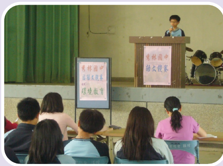
辦理各項語文競賽－ 提升閱讀能力演講朗讀比賽