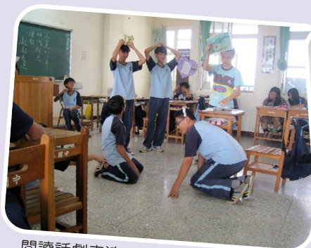
閱讀話劇表演－好文閱讀及成果產出

閱讀也許無法立竿見影，但只要有新的刺激及就可以改變思考及學習。在我們提倡終身學習的理念之下，學習是一個人終生要走的路，現階段我們