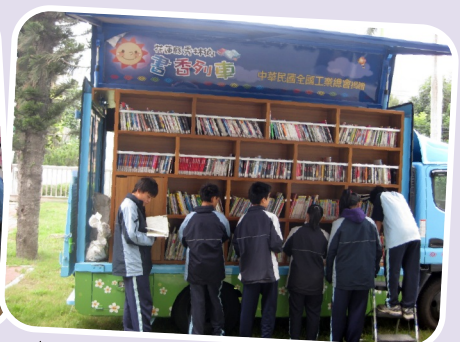
書香列車－結合秀林圖書館社區資源