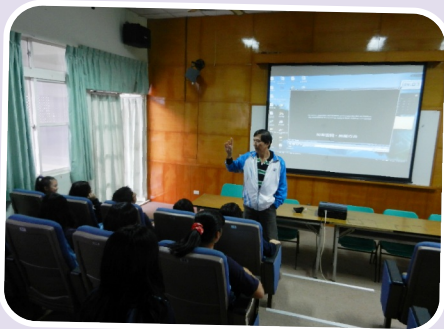
學生電影閱讀賞析－ 從電影中學習閱讀的樂趣