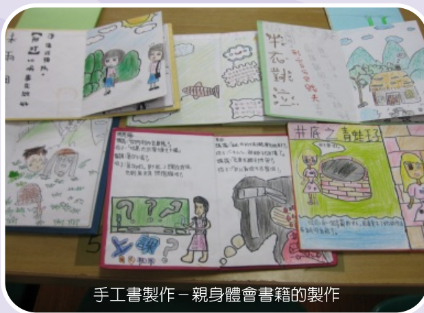
手工書製作－親身體會書籍的製作