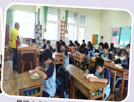
晨讀十分鐘－培養學生閱讀習慣