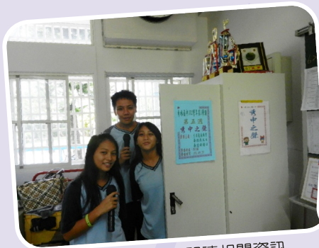
秀中之聲－分享閱讀相關資訊