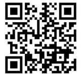
花蓮縣第十九屆讀經會考 獎金及獎狀對照表