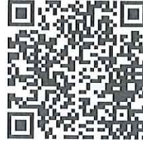
官方 Line 帳號