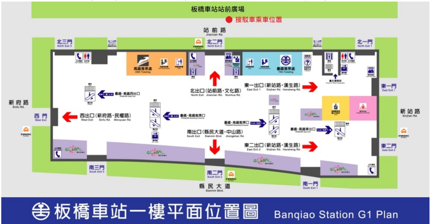
板橋車站一樓平面位置圖 Banqiao Station G1 Plan