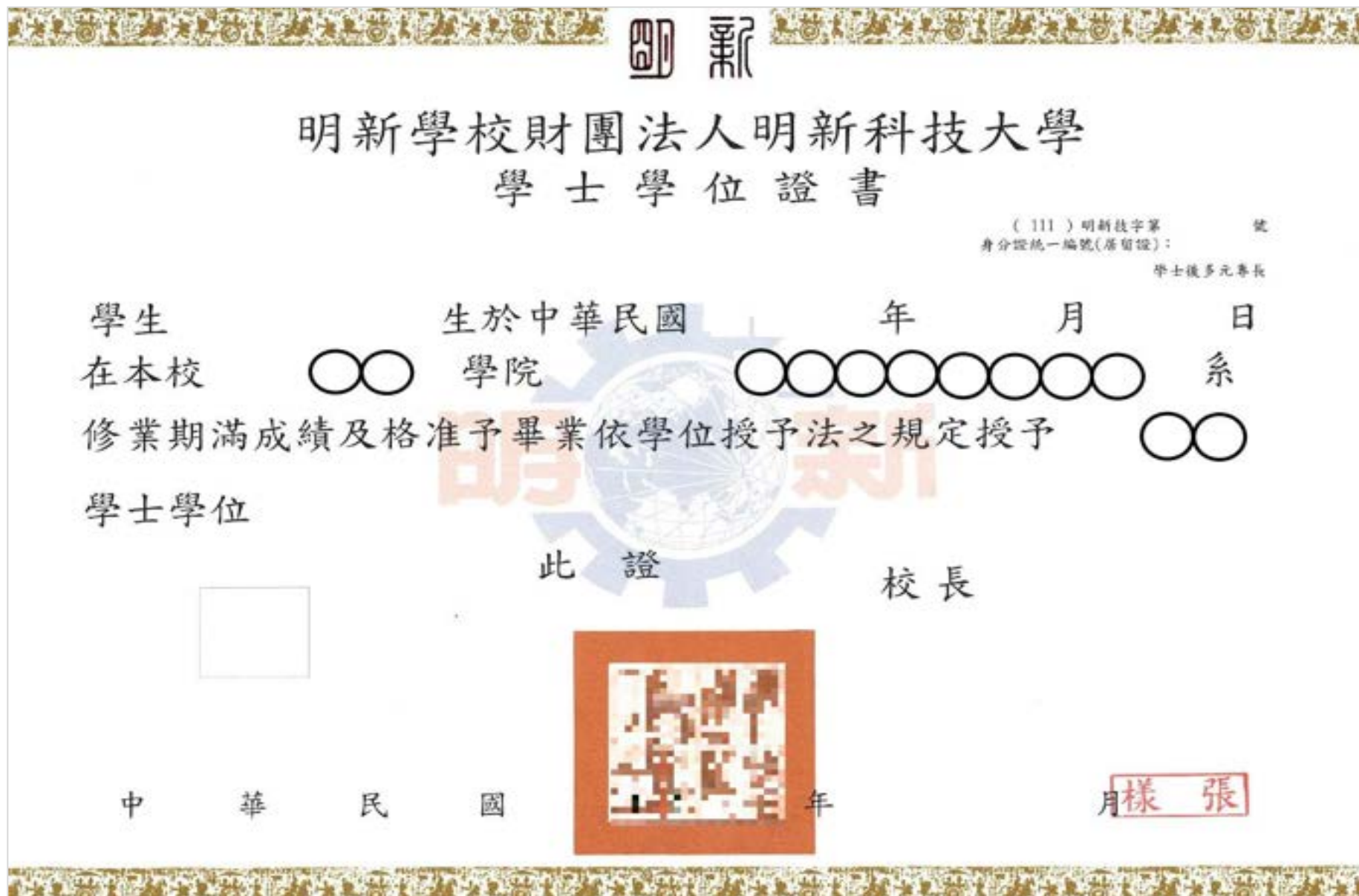
【附錄一】學士學位證書格式樣張(樣張僅供參考，證書格式以該畢業學年度發放為主)